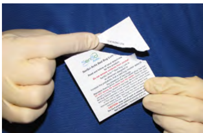
Non tagliare con le forbici. Non rimuovere il contenuto della bustina