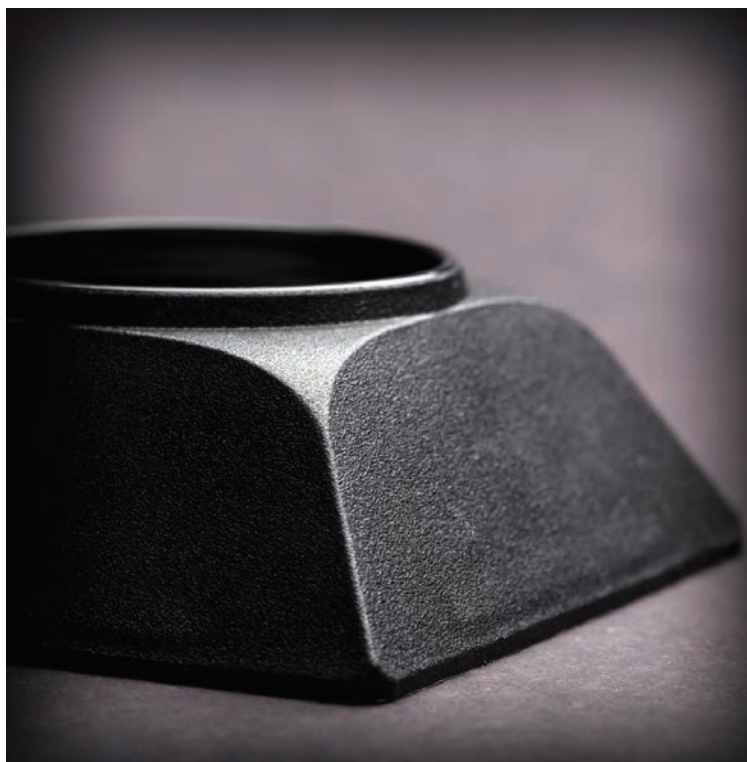
SenSci Volcano misura 7,4 x 7,4 x 2,9 cm