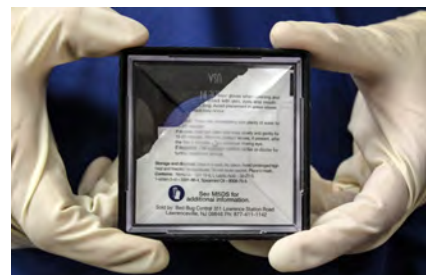
Collocare la bustina aperta nella trappola