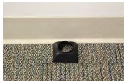
Collocare Volcano sul pavimento