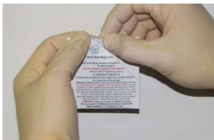
Strappare lentamente lungo la linea pretagliata